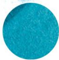
Azure Waters Морська блакить 77617