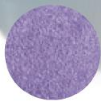
Enduring Iris Букет ірисів 77620