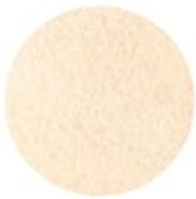
Liquid Gold Рідке золото 77624