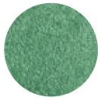
Deep Amazon Джунглі Амазонки 77618

Тіні, що легко і рівномірно наносяться завдяки кремовій текстурі, довго тримаються, підкреслюють виразність погляду